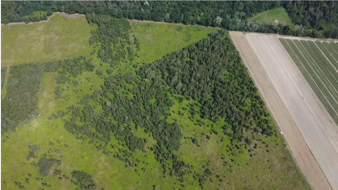
Od strony Lasu, Otulina Parku Chojnowskiego Parku Krajobrazowego