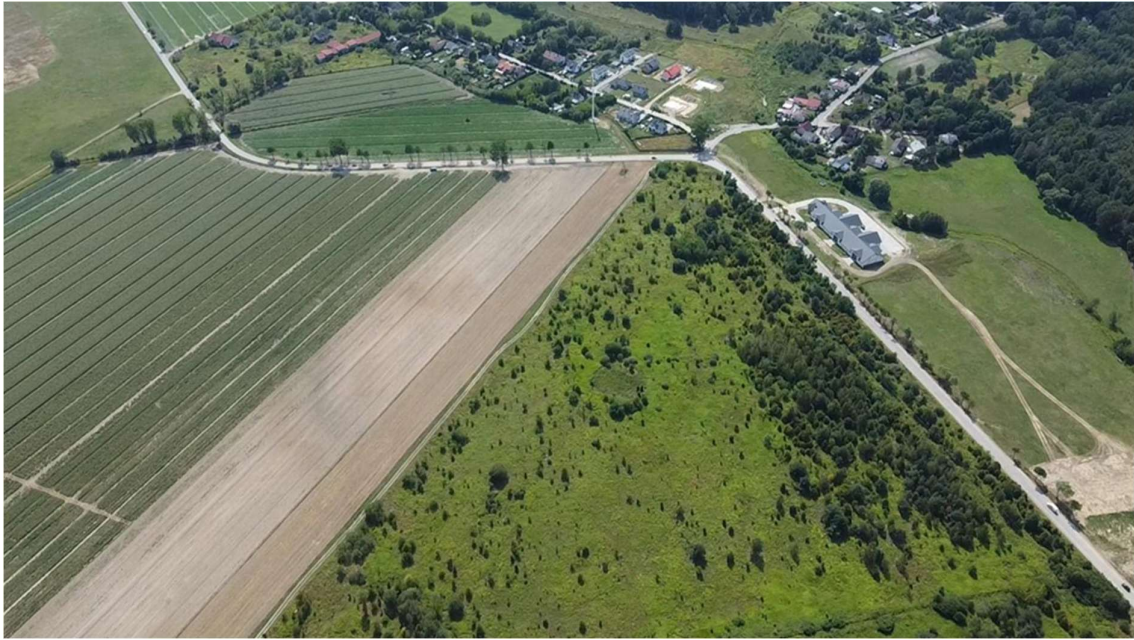
Dojazd do drogi gruntowej od strony ulicy Chrobrego, przystanek PKS